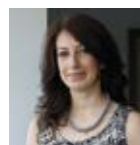
Assessore GIORGIA BARTOLI Ambiente e Agricoltura, Trasparenza, Semplificazione e Innovazione, Ricerca Fondi

organici. Per la carta, invece, è obbligatorio avvalersi del servizio di raccolta settimanale a domicilio che avviene in giornate diverse a seconda del quartiere in cui si abita, conferendo la carta negli appositi contenitori blu che vengono distribuiti gratuitamente ai cittadini presso l'Ufficio relazioni con il pubblico.