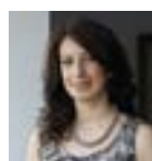
Assessore GIORGIA BARTOLI Ambiente e Agricoltura, Trasparenza, Semplificazione e Innovazione, Ricerca Fondi

P rosegue l'attività di contrasto all'abbandono di rifiuti urbani sul territorio comunale da parte del gruppo delle Guardie Ecologiche Volontarie di Formigine. Un'importante opera al servizio della comunità che non si limita all'individuazione degli autori degli abbandoni, ma comprende anche verifiche a campione sulla correttezza dei conferimenti nel rispetto del Regolamento per la gestione del servizio di raccolta dei rifiuti urbani. Nel corso del 2015, le GEV