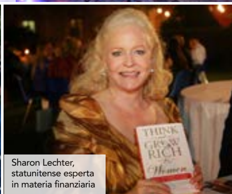
Sharon Lechter, statunitense esperta in materia finanziaria