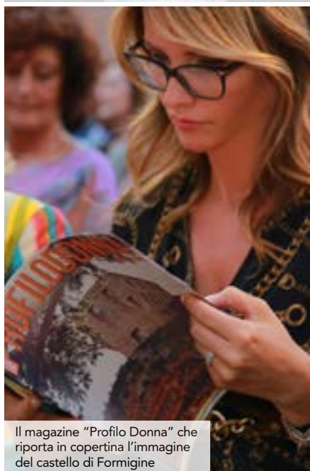
Il magazine "Profilo Donna" che riporta in copertina l'immagine del castello di Formigine