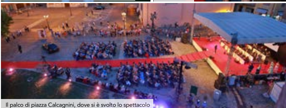
Il palco di piazza Calcagnini, dove si è svolto lo spettacolo