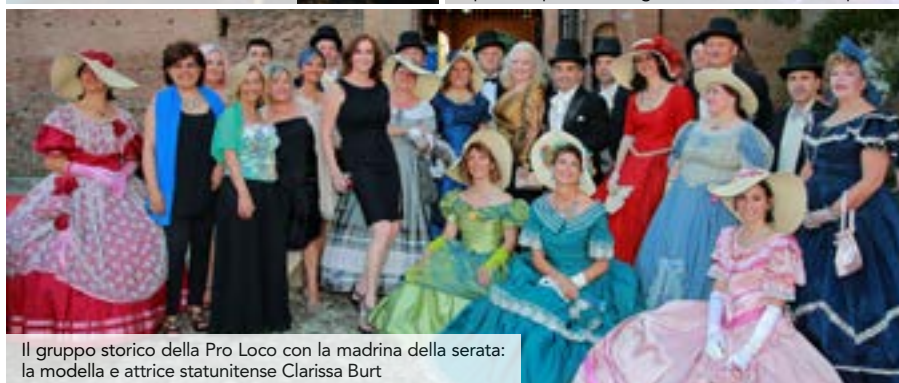
Il gruppo storico della Pro Loco con la madrina della serata: la modella e attrice statunitense Clarissa Burt