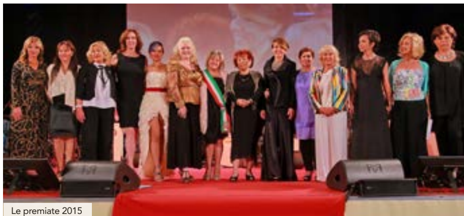
Le premiate 2015