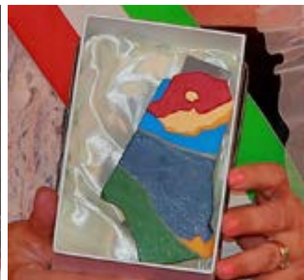
Il Premio realizzato dall'artista Adriano Venturelli