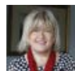
Sindaco MARIA COSTI

P rende il via giovedì 15 ottobre il 26° corso gratuito alla popolazione, organizzato dal Corpo Volontari di Pronto Soccorso-AVAP di Formigine, che si pone l'obiettivo di fornire alcune nozioni di primo soccorso che permettono ad ogni cittadino di poter intervenire efficacemente in una situazione occasionale di emergenza, in attesa del soccorso sanitario professionale. Al termine del corso, che è aperto a tutti i cittadini, verrà rilasciato un attestato di partecipazione a chi avrà preso parte ad almeno cinque delle sette lezioni. Questo il calendario: il 15 e il 19 ottobre in Sala Loggia a Formigine, il 22 e il 26 ottobre a Corlo, il 29 ottobre e il 5 no-