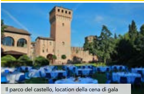
Il parco del castello, location della cena di gala