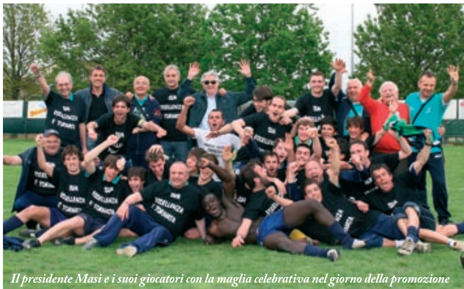
Il presidente Masi e i suoi giocatori con la maglia celebrativa nel giorno della promozione

Si chiude una stagione agonistica ricca di grandi successi Vincono Formigine e Colombaro calcio, Corlo volley e G.S. Pallamano