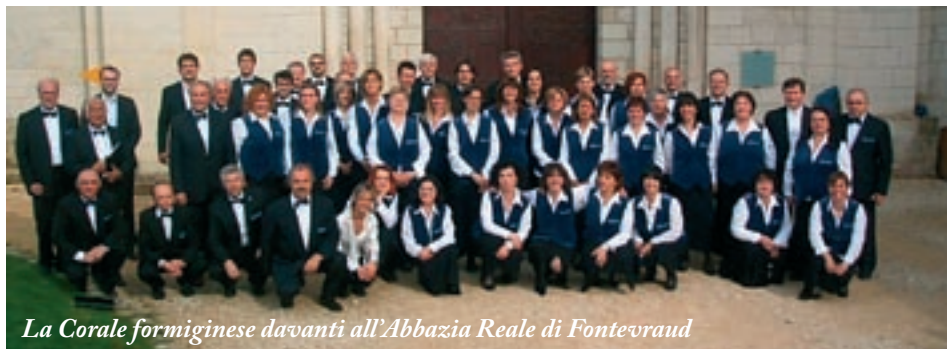
La Corale formiginese davanti all'Abbazia Reale di Fontevraud

Verranno eseguite celebri arie di Puccini, Verdi, Morricone, Grieg, Arensky, Ciaikovski, Albeniz e Stravinsky. L'ingresso è libero.