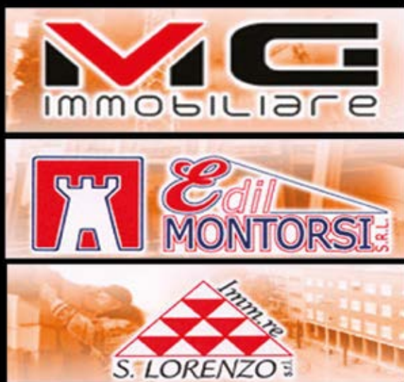
Progetto Grafico: Doriana Donadelli, Kromatica

Via Quattro Passi, 29 - 41043 Formigine (MO) Tel. 059573552 - Cell. 335 7419937 - www.edilmontorsi.it