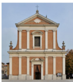
Parrocchia San Bartolomeo Apostolo di Formigine

CON IL PATROCINIO DEL COMUNE DI FORMIGINE