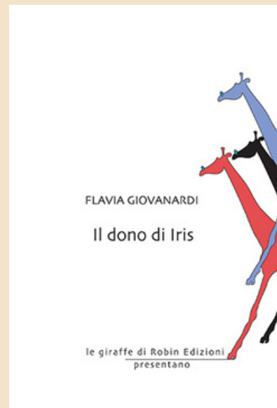
in foto: la copertina del libro